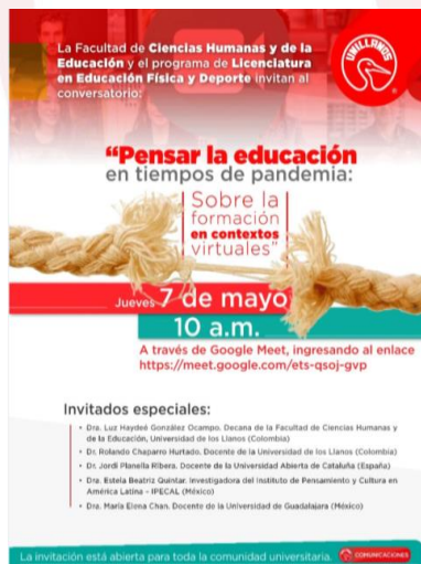
Registro fotográfico 1. Eventos 2020