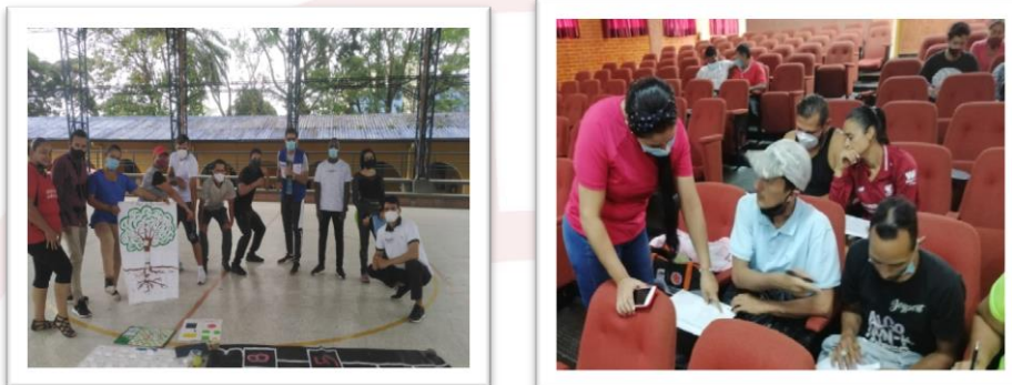
Registro Fotográfico 2. Actividades Convenio IMDER 2021